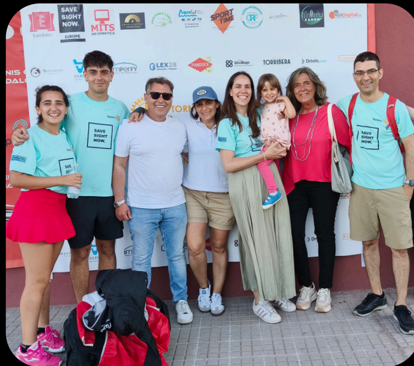
Torneig solidari de Pàdel. Organitzat pel Rotary Club al Club de tennis Badalona el passat 15 de juny de 2025.